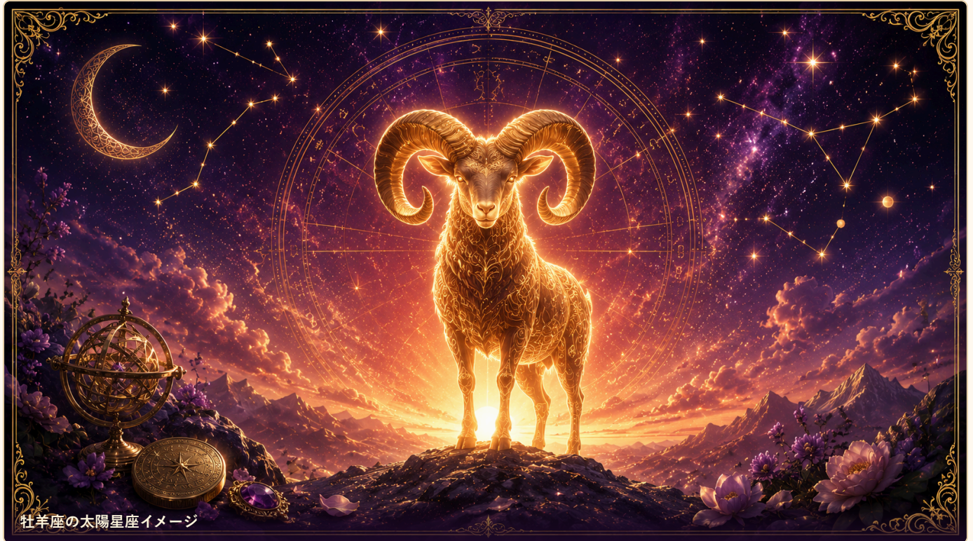
牡羊座の太陽星座イメージ

ここでは、今の恋に出やすい反応を星から軽く確認します。難しく読まず、現在地を見る入口として使ってください。