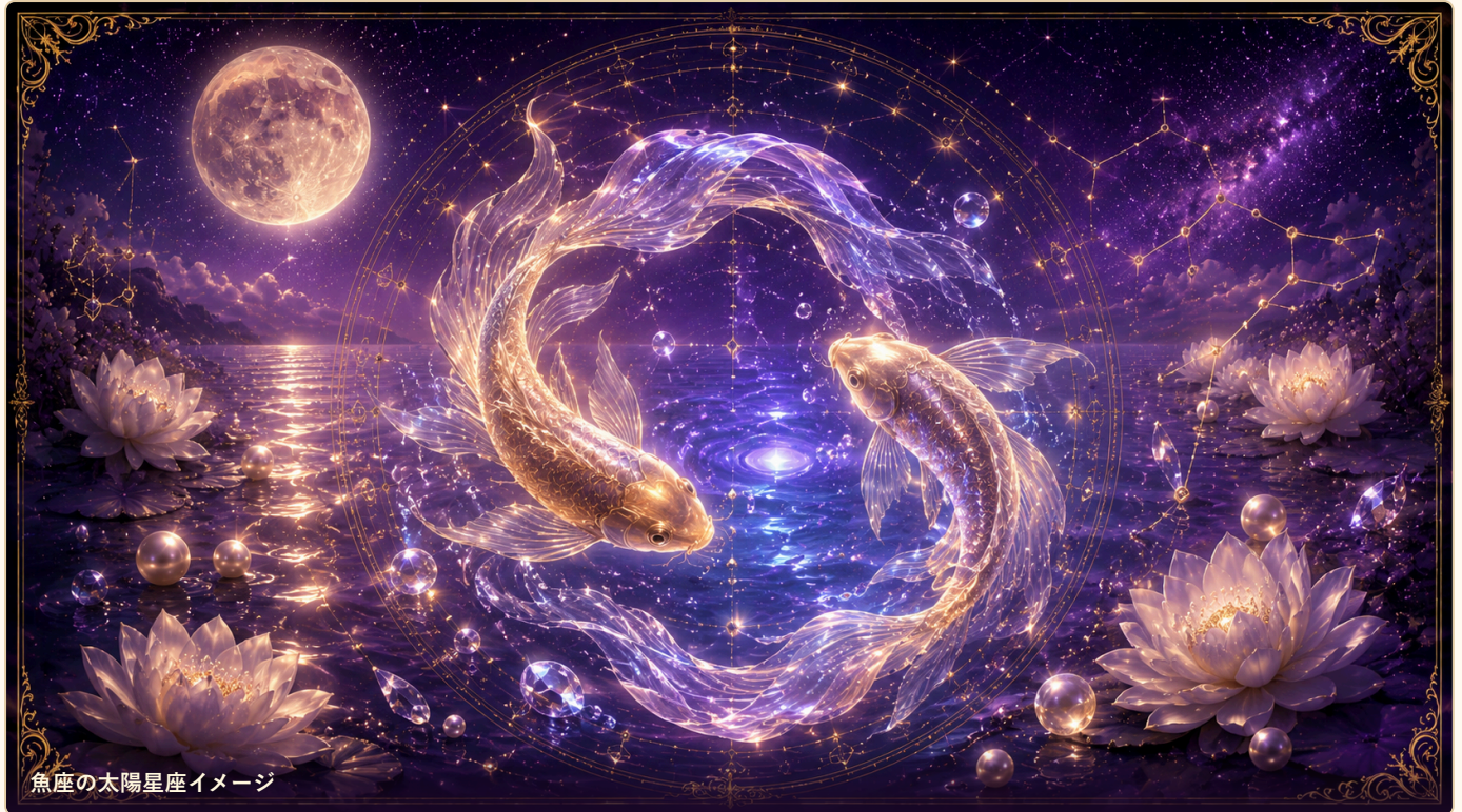
魚座の太陽星座イメージ

ここでは、今の恋に出やすい反応を星から軽く確認します。難しく読まず、現在地を見る入口として使ってください。