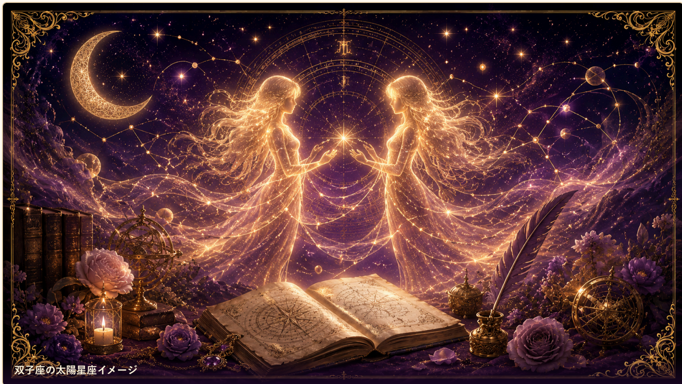
双子座の太陽星座イメージ

ここでは、葵様の恋愛の基本設定を星から見えています。決めつけではなく、愛し方のクセを知るための地図として読んでください。